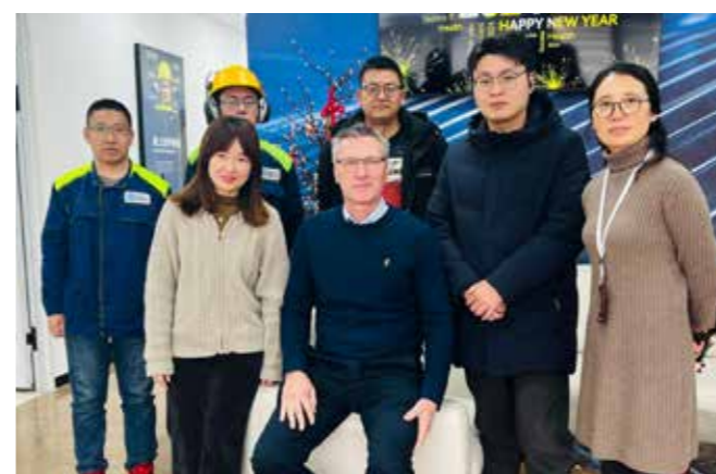
Suzuki Garphyttan 全球各个工厂的协调与合作至关重要。